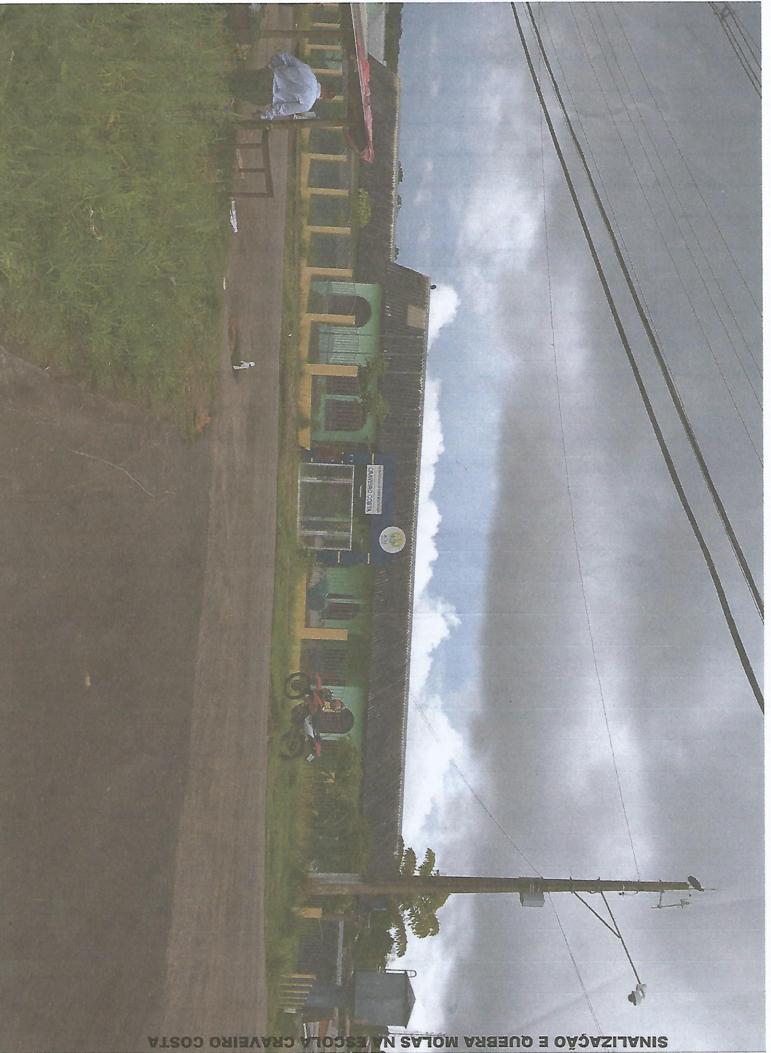
SINALIZAÇÃO E QUEBRA MOLAS NA ESCOLA CRAVEIRO COSTA